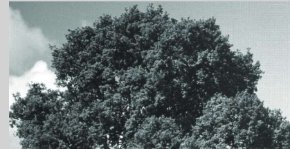
Umwelt schützen – Atomwaffen abschaffen